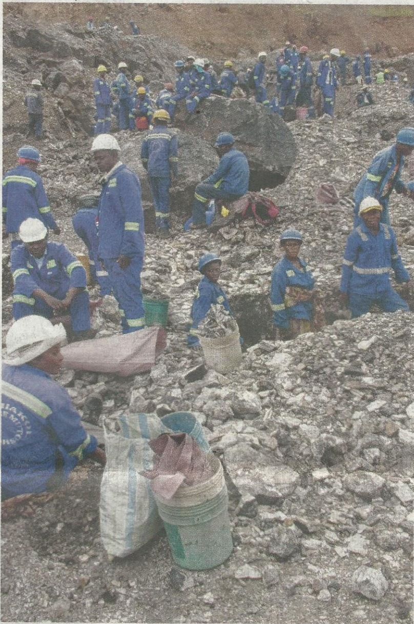
Sur le site de Mutoshi, au Katanga, les travailleurs creusent à mains nues.

Ce vendredi, à la surprise générale, le Roi remerciait les informateurs Georges-Louis Bouchez et Joachim Coens et chargeait Koen Geens d'une mission lui demandant de prendre toutes les initiatives pour « la mise en place d'un gouvernement de plein exercice ». Une mission visiblement acceptée par le vice-Premier social-chrétien sans consulter grand monde au sein de son parti et surtout pas son président, Joachim Coens. Selon des informations du Standaard , la précipitation de Geens lui a valu d'être rappelé à l'ordre par son parti. En acceptant la mission royale, il aurait perturbé la stratégie du CD&V, qui ne voulait surtout pas entrer en scène au risque de devoir annoncer que les élections sont inévitables, mais souhaitait que le PS et/ou la N-VA s'y collent. Toujours selon le Standaard , lors d'une réunion de crise du CD&V dimanche soir, Koen Geens s'est vu imposer des limites : sa mission doit être de courte durée et ne peut viser la constitution d'une coalition Vivaldi, sans la N-VA. Cette injonction va à l'encontre de la mission confiée par le Palais qui, dans les termes, ne limitait pas le champ d'investigation à la seule alliance intégrant la N-VA. Vu le veto du PS sur le programme des nationalistes flamands, la tâche de Koen Geens s'annonce ardue. P. 4